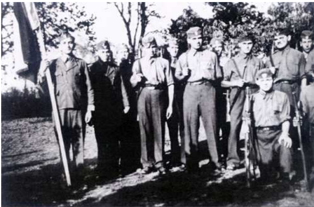
Leventék egy csoportja 1943-ban